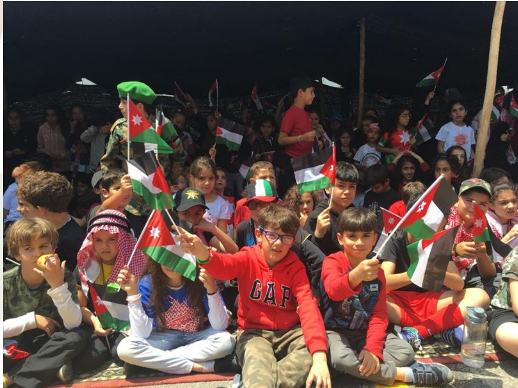
الاحتفال بعيد الاستقلال لطلبة الروضة